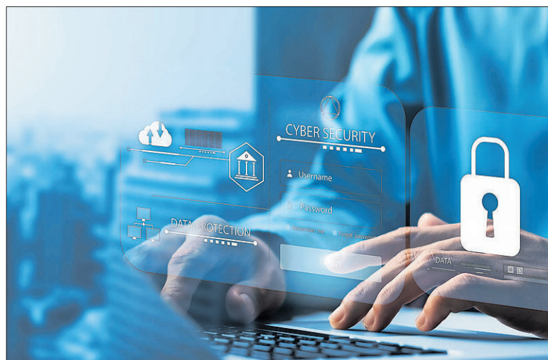
Neue Vorgaben erhöhen die Anforderungen an IT-Sicherheit.

Selbst Unternehmen, die nicht direkt unter das Gesetz fallen, können mittelbar betroffen sein. Große Marktteilnehmer - insbesondere aus kritischen Sektoren - werden von ihren Lieferanten und Dienst-