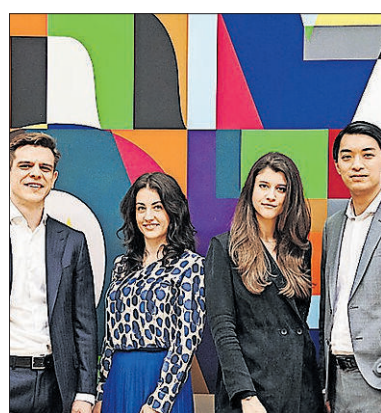
Die neuen Wiener Partner und Counsel bei CMS.